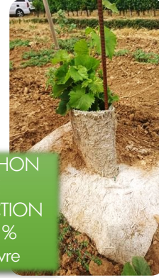
MANCHON DE PROTECTION 100 % chanvre