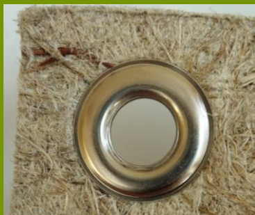
Feutre végétal qui se plie, se coud, se perce

Le chanvre roui est issu du rouissage. Cela consiste à laisser le chanvre en champs après avoir été coupé. L'alternance de pluie et d'ensoleillement provoque le phénomène rouissage qui permet d'obtenir cette fibre, couleur gris souris.