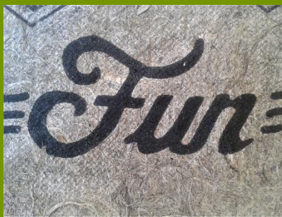
Possibilité d'impression noir et blanc ou couleur (texte, logo, photo)